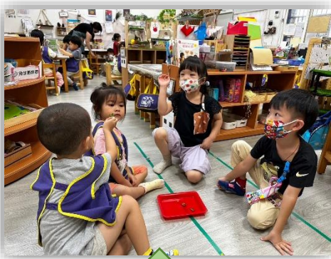
討論葉子變乾變皺的原因