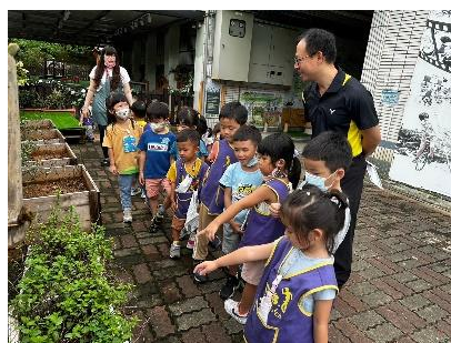
尋找校園中的香草植物

孩子在校園散步的途中發現，除了在教室泡的茶葉以外，校園中還有其他植物也有香味耶！於是我們決定出發去校園尋找並收集有沒有其他的香草植物囉！第一站我們來到幼兒園旁邊的空地，找到了幼兒最熟悉的 薄荷 、以及 金萱 、 迎香 、 沁玉 、 青心烏龍 等四種茶葉，接著再往菜園裡面走，幼兒們還發現了 萬壽菊 ，老師將這六種香草植物的葉子拔下來讓幼兒觀察，摸摸看、聞聞看，從香味出發引起孩子對於香草植物和茶葉的興趣，最後和幼兒討論不同植物聞起來的香味像什麼？聞起來有什麼感受？讓幼兒透過視覺、嗅覺、觸覺來觀察並比較，藉此發現其中差異。