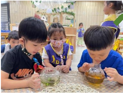
幼兒在茶藝區進行泡茶實驗

透過保留香氣的實驗幼兒們一致認為用熱水來泡香草植物會最有味道，而其他像是用剪碎的、淋雨的、用搓等方式也會產生香氣，但是沒有那麼明顯，推究熱水是最成功能保留香氣的原因，幼兒覺得之前在茶藝區的茶杯沒有洗乾淨，裡面還有一點黃黃的和茶葉的味道，那是因為用熱水泡的關係，所以味道才能停留在杯子裡那麼久，所以用熱水泡香草植物的方式是最能產生香氣的，那麼除了用熱水，用其他溫度的水也能產生一樣的結果嗎？