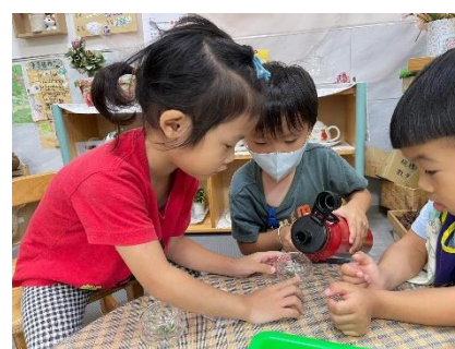
將香草植物泡進熱水