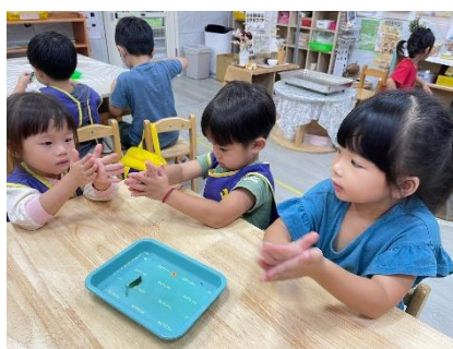
搓揉至香草植物變色