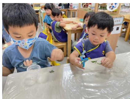
剪刀組將香草植物剪碎

放葉子組： 將香草植物放回原本的茶樹裡，然後將其放在有香味的葉子上 10 秒鐘。