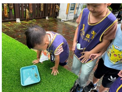
將香草植物淋濕後曬太陽