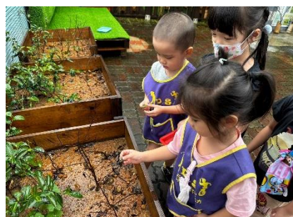
放在有香味的葉子上 10 秒